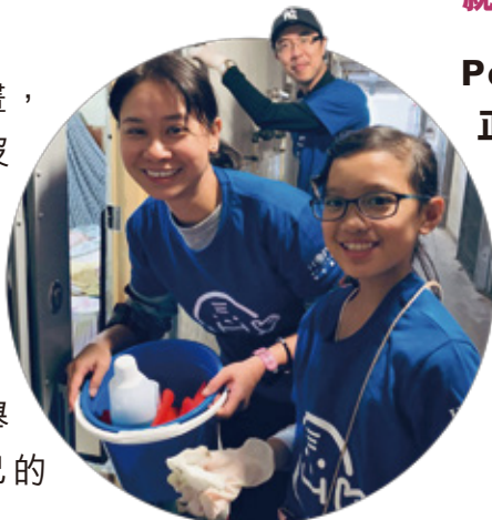
『長者希望日』是個給小朋友服務社會的好機會。

80歲的杜伯伯醉心繪畫，但是年青時的他一直沒有機會和資源去學習。在65歲退休之後，他開始拾起畫筆。15年以來，杜伯伯的佳作不計其數，他的心願是舉辦一個畫展去分享自己的作品。