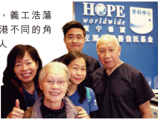
在『長者希望日』當天，許多長者在我們牙科中心接受免費的牙齒檢查服務。之後我們幫他們申請及善用政府提供的資源繼續治療。

開幕禮之後，義工浩蕩地出發到香港不同的角落，實踐「人人耆望都可達到」。當天的服務包括探訪、家居清潔、健康及牙科檢查，以及幫忙個別長者達成心願的「多走一步」活動。