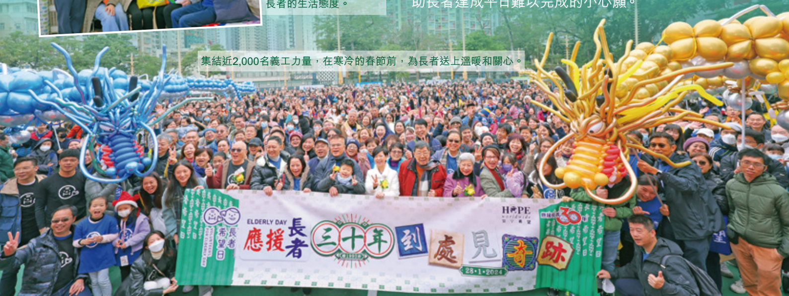
集結近2,000名義工力量，在寒冷的春節前，為長者送上溫暖和關心。