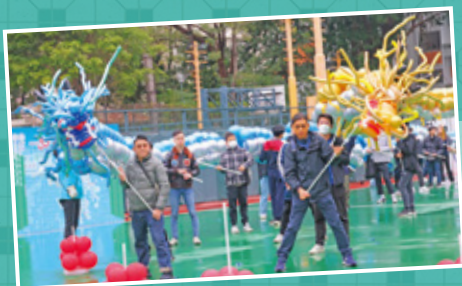
大會在開幕禮上準備了兩條150呎長的巨龍遊走，用來祝福寰宇希望30週年。

義工在開幕儀式後分批出發到全港各區公共屋邨探訪長者及送上福袋；大會安排了145名義工到護老院探望長者；更有數百位義工為長者進行「耆望成真」計劃，幫助長者達成平日難以完成的小心願。