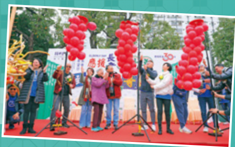
主禮嘉賓一同拉響氣球炮仗，為活動揭開序幕。